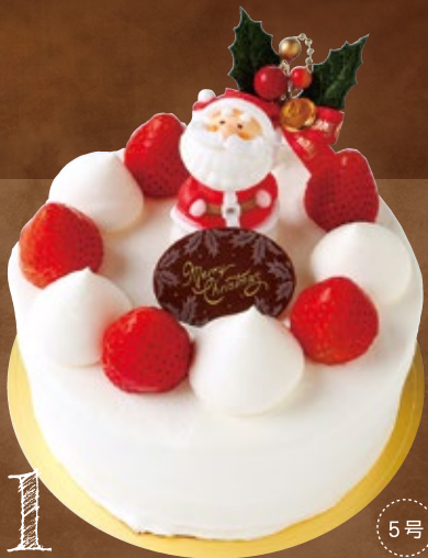
1 X'mas生クリームデコレーション

4号(12cm) 税込 3,600円 (3,334円) 5号(15cm) 税込 4,500円 (4,167円) 6号(18cm) 税込 5,800円 (5,371円) 7号(21cm) 税込 7,000円 (6,482円) 8号(24cm) 税込 9,200円 (8,519円)