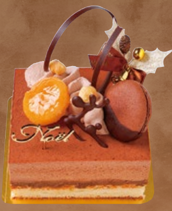
6 限定30台 ショコラベトナム

約11cm×10cm 税込 3,800円 (3,519円) ダックワーズ生地にベトナム産62%のショコラムースとアプリコットのガナッシュをサンドしました。