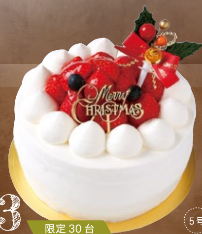
3 X'masいちごスペシャル

5号(15cm) 税込 5,400円 (5,000円) 6号(18cm) 税込 6,800円 (6,297円)