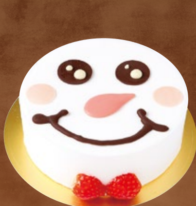
5 限定30台 スノーマン

5号(15cm) 税込 4,200円 (3,889円) あっさりとした口だけの良いスポンジに、パナラムースと苺のジュレをサンドしました。