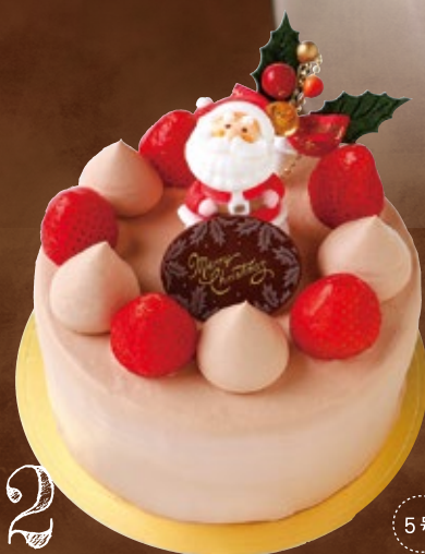
2 X'mas生チョコデコレーション

4号(12cm) 税込 3,600円 (3,334円) 5号(15cm) 税込 4,500円 (4,167円) 6号(18cm) 税込 5,800円 (5,371円) 7号(21cm) 税込 7,000円 (6,482円) 8号(24cm) 税込 9,200円 (8,519円)