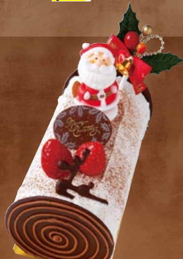
7 限定50台 ブッシュ・ド・ノエル

約17cm 税込 4,000円 (3,704円) クリスマスの定番、チョコ生地にはいちごとバナナをたっぷり使用した切り株型のケーキです。