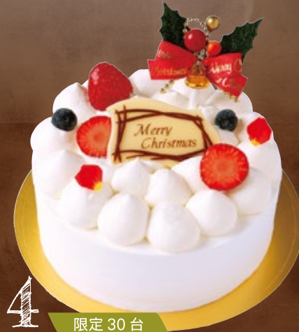
4 X'masダブルフロマージュ